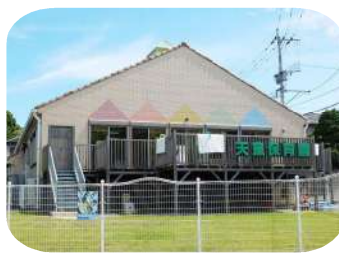
(未満児 園舎(保育園))

2つの棟は細い路地を挟んで隣接していて園庭やお遊戯室を使うために職員も園児も気軽に行き交っています。