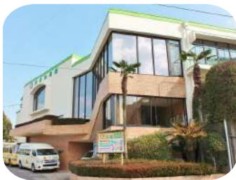
(以上児 園舎(幼稚園))